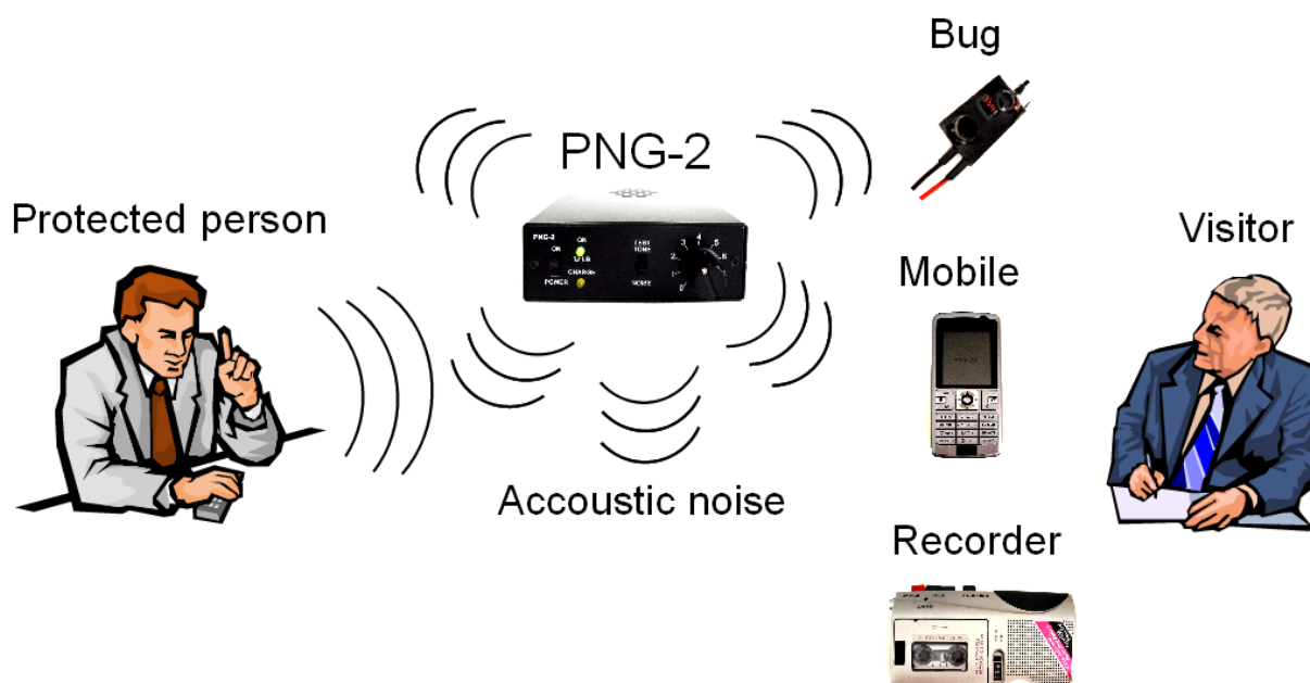
Obr.1 Příklad aplikace zašumění prostoru při jednání. PNG-2 by měl být umístěn mezi jednajícími osobami, pokud možno blíže k návštěvníkovi.

Správně použitý PNG-2 zamezuje provedení nahrávky konverzace nebo ilegálně provedenou nahrávku výrazně znehodnotí. Šumem znehodnocenou nahrávku již nelze použít jako kompromitující materiál. Poškození nahrávky je přímo úměrné akustické intenzitě bílého šumu vycházejícího z reproduktoru PNG-2. Vždy platí, že by měla být nastavena nejvyšší možná ještě přijatelná úroveň šumu. Na obr.1 je příklad použití PNG-2 při jednání. Potřebné nastavení výstupního výkonu závisí zejména na vzdálenosti mezi PNG-2 a návštěvníkem (Visitor).